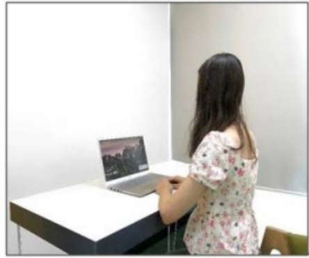
图3：侧后方第二机位效果图。

第二机位设备仅用于监测考试环境，请保证其不会对复试造成干扰。手机作为第二机位“加入会议”后，在“更多”界面“断开音频”，避免多设备啸叫，如下图所示：