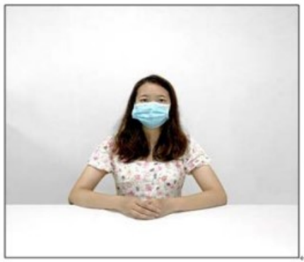
图2：正前方第一机位效果图。