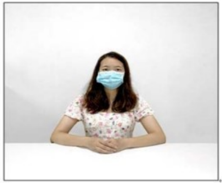
图2：正前方第一机位效果图。