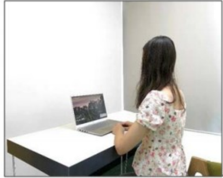
图3：侧后方第二机位效果图。

第二机位设备仅用于监测考试环境，请保证其不会对面试造成干扰。手机作为第二机位“加入会议”后，在“更多”界面“断开音频”，避免多设备啸叫，如下图所示：